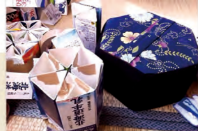
▲被災地の人と話しながら作った座イス。牛乳パックを六角形に組み合わせた土台に、綿と布を被せて完成