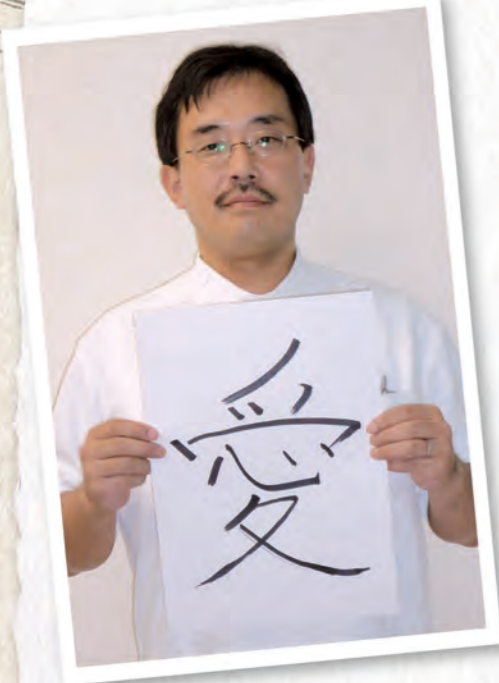
スタッフ日記 日々百景

豊川メイツは、今年も「愛」のある医療を提供したいと考えています。長期間続けていかななくてはならない透析治療は、多くの患者さんにとって、肉体的にも精神的にもハードなものです。だからこそ、私たちがスタッフは自分の家族を想うような愛情で、患者さんのケアを行ってまいります。 治療中に厳しいことを言うかもしれないですが、すべては患者さんの体のためです。大変なことも多いと思いますが、ともに透析治療をがんばっていきましょう。皆様にとって、今年がHAPPYな1年となるように願っています。