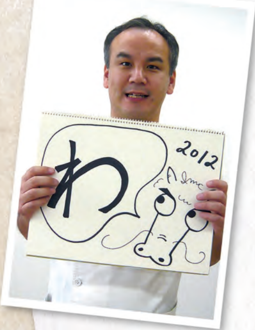
スタッフ日記 日々百景

私たちが今年の目標とする一文字は「わ」です。「わ」は会話の「話」であり、調和の「和」であり、連携の「輪(環)」でもあります。具体的には、患者さんと職員の間、職員同士の間、地域の先生や医療・福祉関係の皆さんとより多くコミュニケーションすることです。 それが互いの尊重や理解を生み、患者さんや地域からの信頼につながっていくと考えています。 磐田メイツクリニックは皆さんに安心して透析ライフを過ごしていただけるよう、地域の先生との連携をより強固なものとしていきます。今年もよろしくお願いたします。